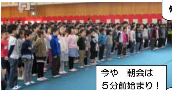
今や 朝会は 5分前始まり！