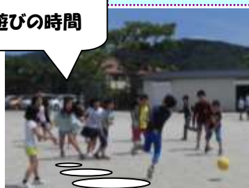
ボール遊び・一輪車・遊具遊び…