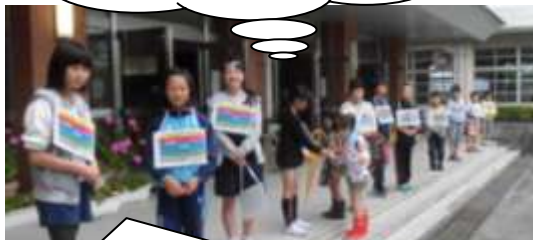
あいさつレベル5を目指して！ 広報委員会の朝のあいさつ運動